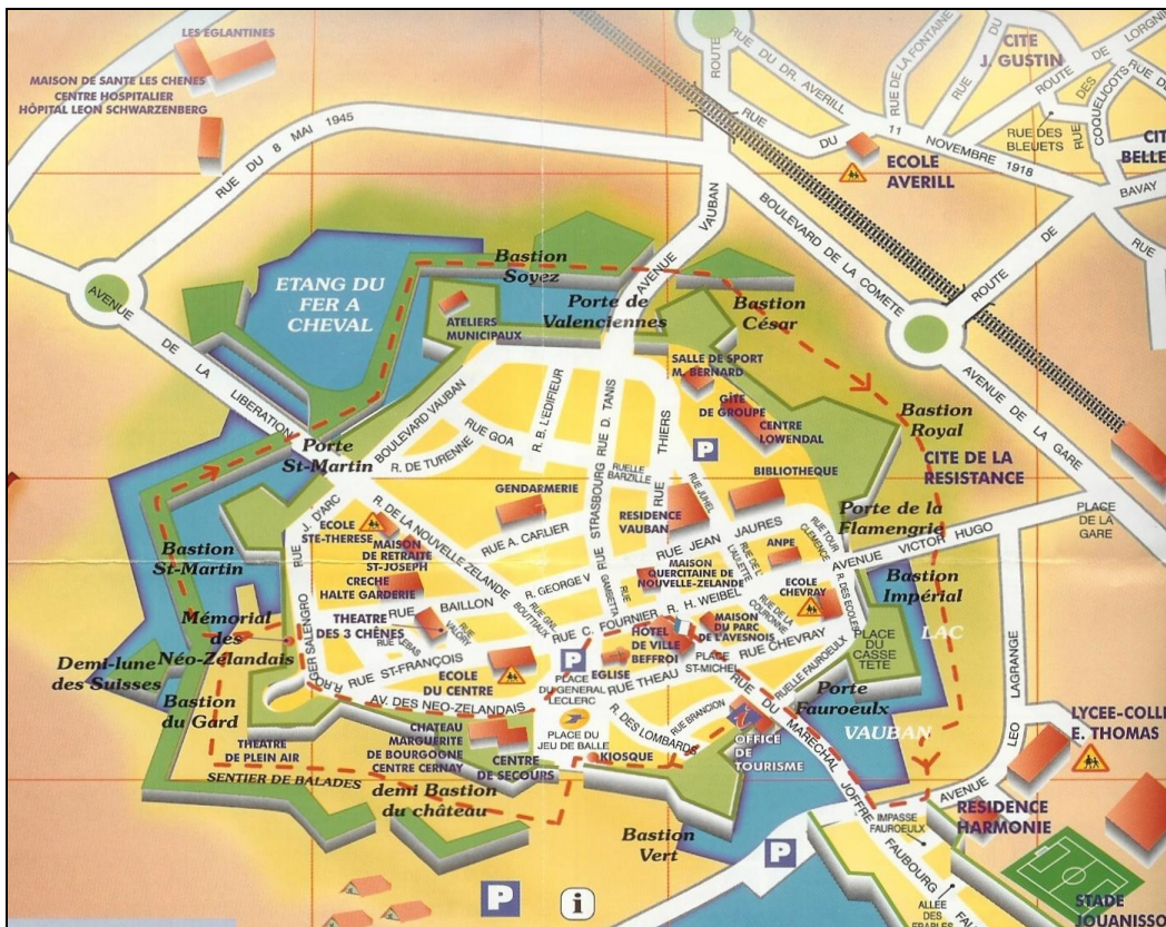
Plattegrond van Le Quesnoy met linksonder het Mémorial des Néo-Zélandais en rechtsboven de Rue du Dr. Averill en de École Averill.

De band tussen Le Quesnoy en Nieuw-Zeeland is overduidelijk zichtbaar. Behalve het monument aan de stadsmuur is er een Rue de la Nouvelle Zélande en een Avenue des Néo-Zélandais. Cambridge in Nieuw-Zeeland is de zusterstad. In de Saint-Andrew's Church van Cambridge is een glas-in-loodraam aangebracht met een voorstelling van soldaten die ladders beklimmen.