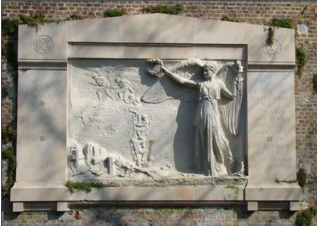
Het Nieuw-Zeelandse monument in Le Quesnoy.

‘In honour of the men of New-Zealands through whose valour the town of Le Quesnoy was restored to France, 4 th November 1918’