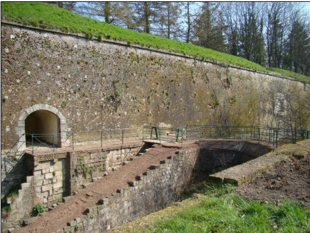
Het poortje in de stadsmuur en het stenen bruggetje over de droge gracht waar de ladder werd geplaatst. De situatie in 1918 (boven) en anno 2011 (beneden).