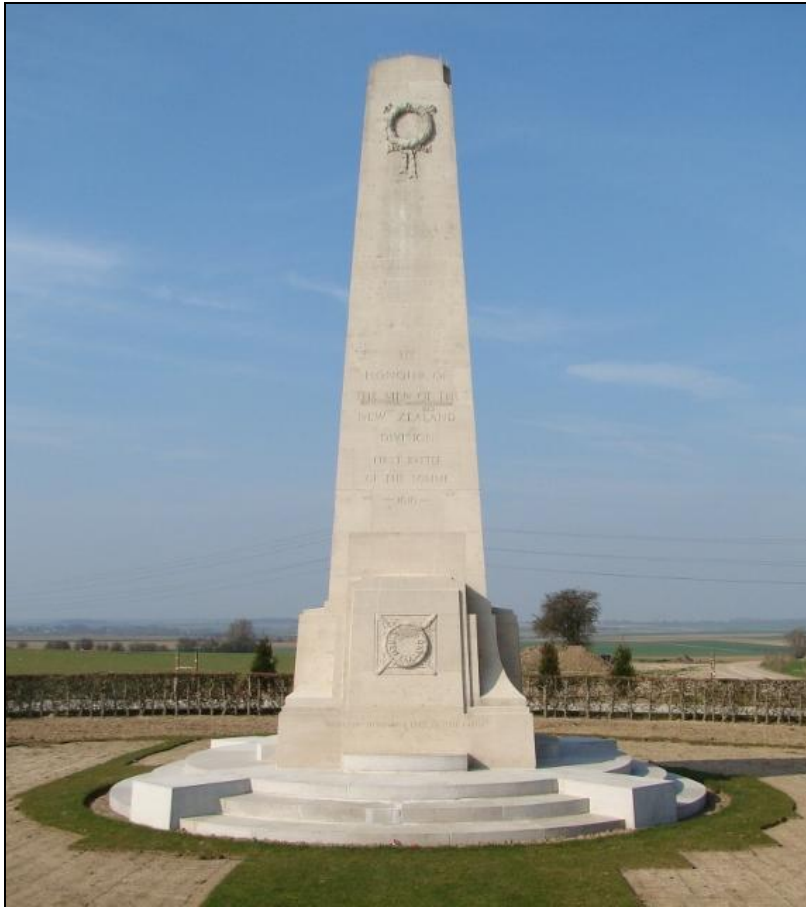
Het Nieuw-Zeelands monument te Longueval aan het Sommefront.

tekst: 'From the uttermost ends of the earth'. Ze staan in 's Graventafel en Mesen in de Vlaamse Westhoek en bij het dorp Longueval aan het Sommefront.