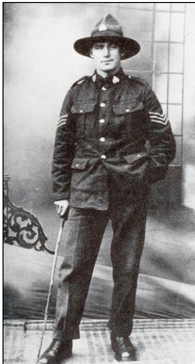
Een sergeant van het Otago Regiment in 1918 met de karakteristieke hoed.

Na het debacle van Gallipoli werden de Anzacs in 1916 naar het Westelijk Front gestuurd en namen ze deel aan alle bloedige operaties van het Britse leger. Op 1 maart 1916 werd de Nieuw-Zeelandse divisie officieel gevormd en eind april waren alle eenheden over vanuit Egypte en gepositioneerd bij Armentières. 2 Tot aan de oprichting van het aparte Australische korps in 1918 vochten de Nieuw-Zeelanders veelal zij aan zij met de Australiërs, hetgeen niet wil zeggen dat ze zonder meer uitwisselbaar waren. Niet alleen hun hoofddeksel was anders. Die van de Nieuw-Zeelanders stond bekend als de 'citroenpers' door de vier deuken in de puntige vilthoed. En hun bijnaam 'kiwi's' verwees naar een typische Nieuw-Zeelandse loopvogel.