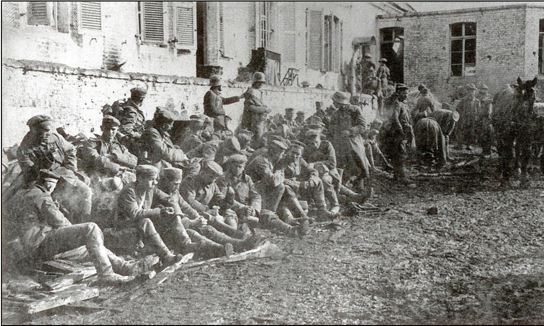
In Le Quesnoy gevangen genomen Duitse militairen.