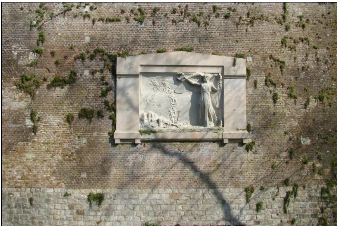
De binnenste stadsmuur van Le Quesnoy met het Nieuw-Zeelands monument.

Le Quesnoy is een kleine vestingstad in Noord-Frankrijk op zo'n 15 km ten zuiden van Valenciennes. De geschiedenis ervan gaat terug tot in de Middeleeuwen. Le Quesnoy werd in 1659 bij het Franse koninkrijk gevoegd en omgevormd tot één van de Noord-Franse villes fortifiées naar de plannen van maarschalk Vauban. Rondom de stadsmuren werden acht bastions geconstrueerd. De stad kwam eind augustus 1914 in Duitse handen na de slag om de grenzen en de Franse terugtocht. En dat zou zo blijven tot november 1918 toen het Duitse leger op zijn beurt aan het terugtrekken was. Op 4 november 1918 stond de Nieuw-Zeelandse divisie als onderdeel van het Britse Derde Leger voor de stadsmuren en kreeg de opdracht Le Quesnoy in te nemen. En hoe verover je een vestingstad? Met een ladder natuurlijk zoals ze dat in de Middeleeuwen deden.